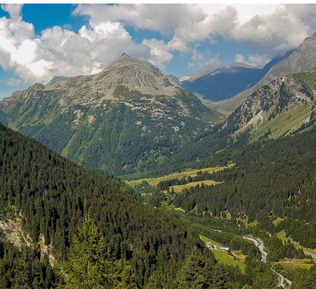
Vue sur la route du col qui mène au val Bregaglia.

On accède à Maloja en bus depuis Saint-Moritz ou Chiavenna.