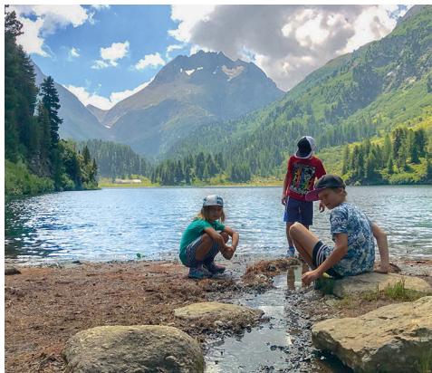
Temps fort pour les enfants: la baignade et les jeux au bord du lac de montagne.