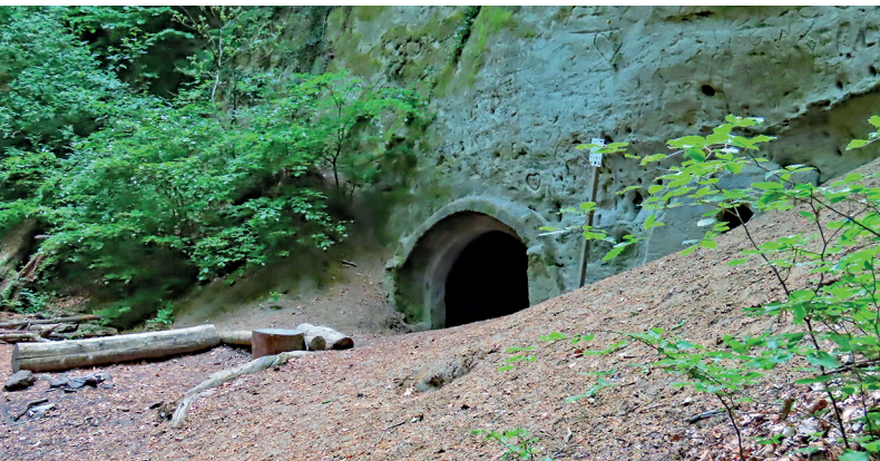
Autrefois, la «grotte des 5 minutes» servait à entreposer la bière et la glace.

Restaurant Burg Hohenklingen, 052 741 21 37, burghohenklingen.com