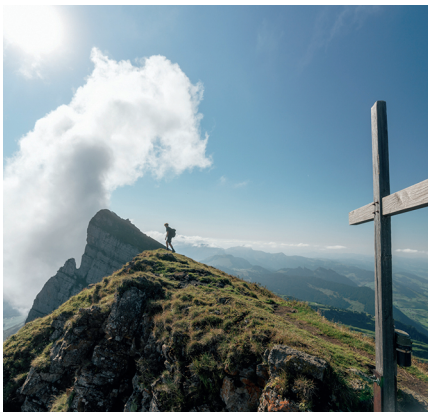
La croix sommitale avec vue sur le Brisi et le lac de Walenstadt.