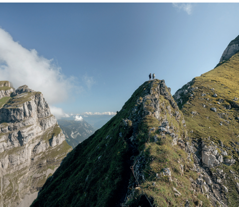
Vue depuis la dernière arête sur le Schibenstoll (à gauche), juste avant le sommet du Zuestoll. Photo.

Remontées mécaniques du Toggenbourg, 071 998 68 10, www.sellamatt.ch/bergbahn Hôtel de montagne Alp Sellamatt, téléphone: 071 999 13 30, www.sellamatt.ch/essen