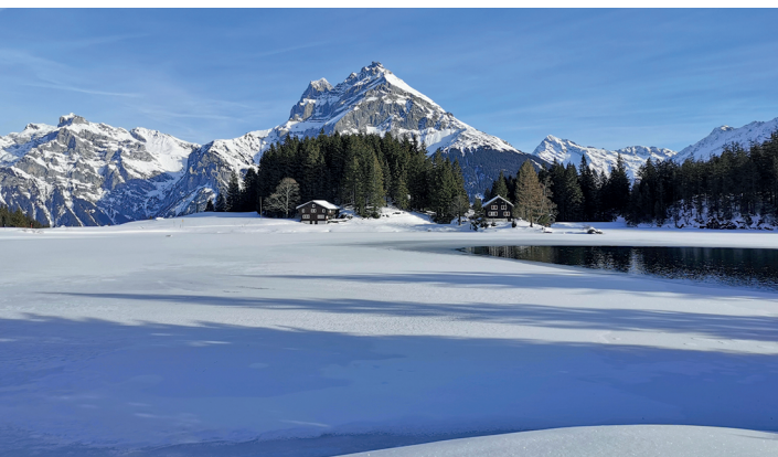
L'Arnisee et le Windgällen en arrière-plan.

Berggasthaus Alpenblick, Arni, 041 883 03 42, www.berggasthaus-alpenblick.ch Téléphérique Amsteg-Arnisee, 041 883 12 47, www.amsteg.arnisee.ch