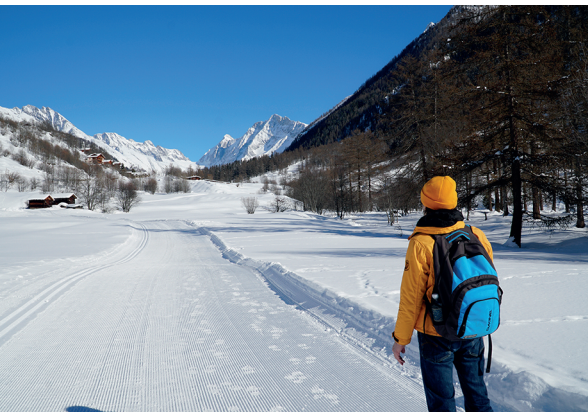
Le chemin de randonnée hivernale bien aménagé longe en grande partie la Lonza, de village en village.

Hôtel Bietschhorn, Kippel, 027 939 18 18, www.hotel-bietschhorn.ch