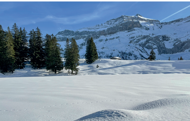
De la rive du lac Retaud, belle vue sur la Becca d'Audon.

Restaurant Col du Pillon, 024 492 10 00, www.glacier3000.ch