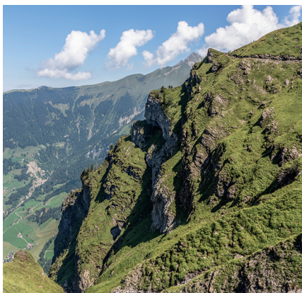
Les randonneuses et randonneurs sur la crête semblent tout petits.