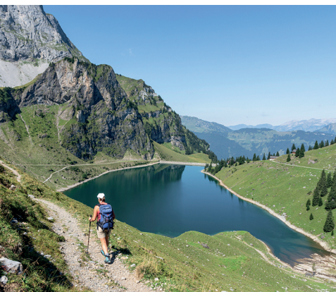
Après la première montée, le lac Bannalpsee se montre dans toute sa splendeur.

https://brunni.ch/de/Detail/walenpfad Auberge de montagne Chrüzhütte, 041 628 23 09, https://chruezhuette.ch/