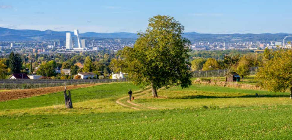
Vue de Maienbühl, avec les tours Roche qui définissent l'agglomération de Bâle.