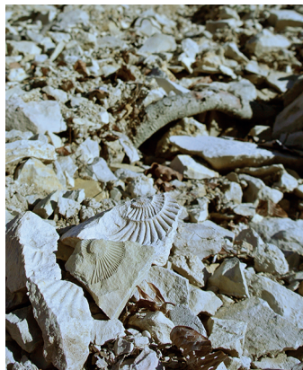
Avec un peu de chance, on trouvera de superbes fossiles.