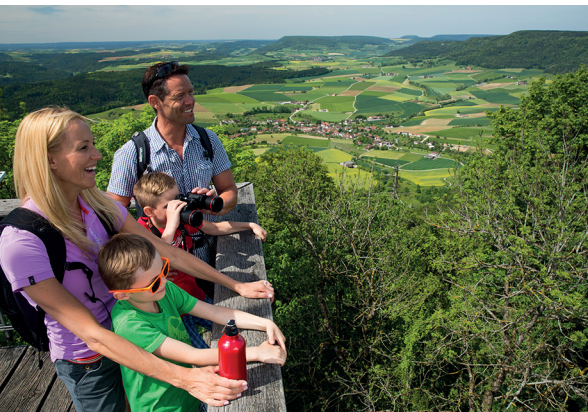
On l'a fait! Après avoir gravi un escalier de 100 marches, la famille profite de la vue.

Waldwirtschaft Schlossranden (buvette/restaurant d'été), 079 933 04 78