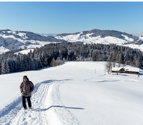
Une ancienne ferme appenzelloise à Oberhaumösi avec son banc en plein soleil.

Restaurant de montagne Osteregg, 071 364 12 19, www.bergrestaurant-osteregg.ch Auberge de montagne Blattendürren, 071 364 17 63, www.blattenduerren.ch