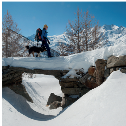
Un pont en pierre sur le Kreuzboden.