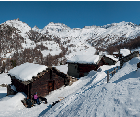
La Triftalp et, à l'arrière sur la gauche, le Lagginhorn.

Café Triftalp, 027 958 66 16, www.triftalp.ch