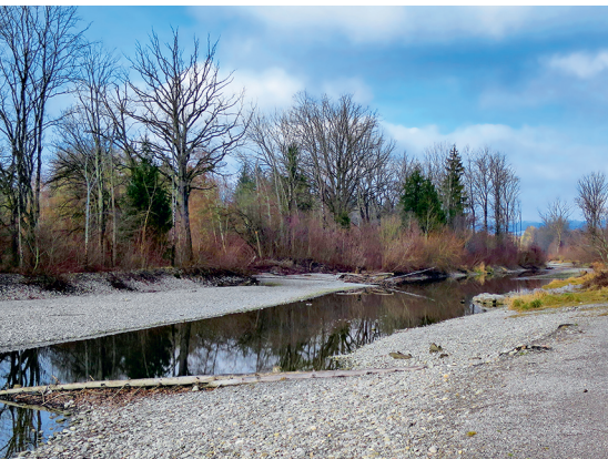
Le Hunzigenau et sa superbe plaine alluviale.

Parc zoologique Dählhölzli, 031 357 15 15, www.tierpark-bern.ch