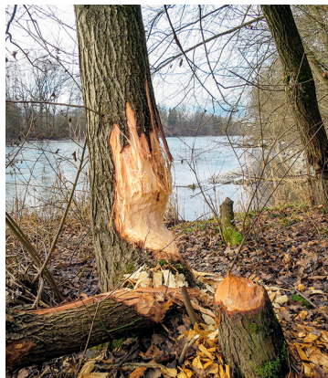
Des castors ont œuvré ici.