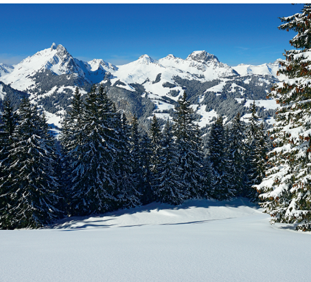
La randonnée sur la Høji Wispile déroule un panorama grandiose.

Auberge de montagne Wispile, 033 748 96 32 Bistrot de montagne Ōsi Perreten, 079 280 11 27 (toujours ouvert par beau temps et lorsque les