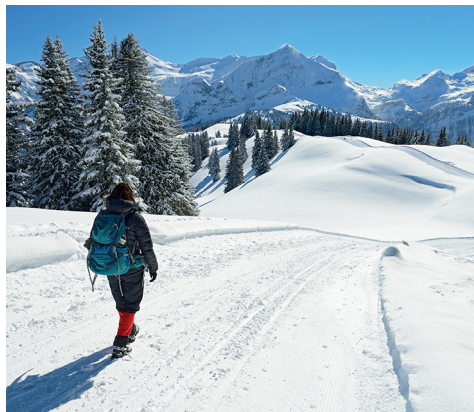
La Walliser Wispile toujours en point de mire.