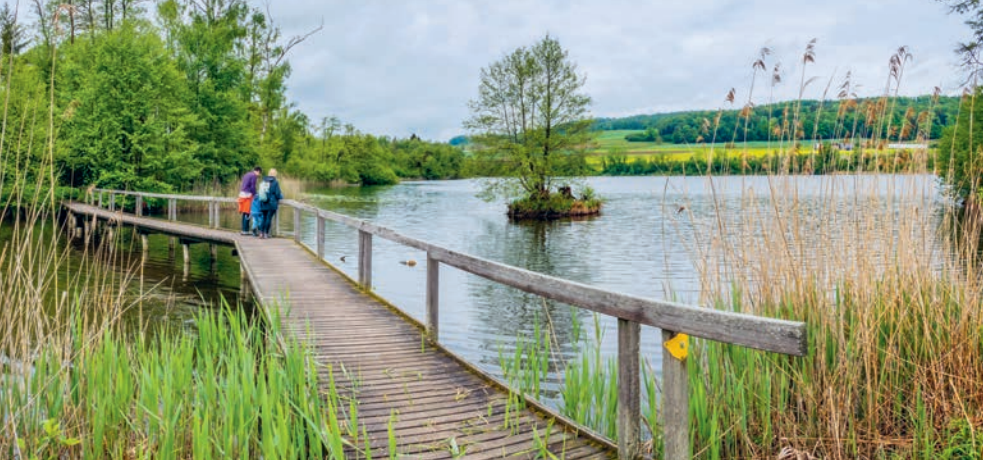
Idyllisch: der Holzsteg am Hüttwiilersee