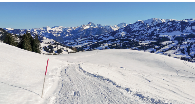
Am Sonnenhang des Rellerli geniesst man viel Weitsicht.

Hotel Ermitage, Schönried, 033 748 04 30, www.ermitage.ch