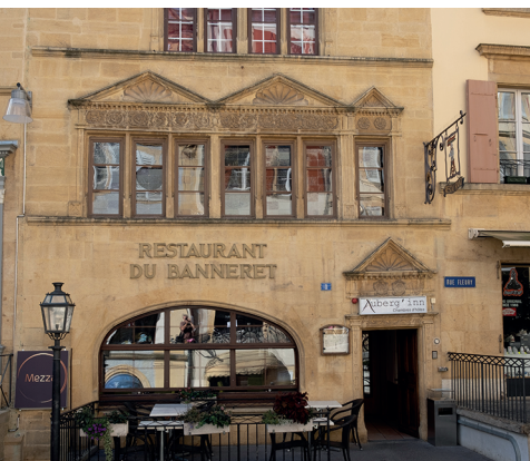
Im Zentrum von Neuenburg ist der gelbe Stein allgegenwärtig.

Zahlreiche Restaurants in Neuenburg. Hôtel Palafitte, Neuenburg, 032 723 02 02, www.palafitte.ch Restaurant Le Silex, Hauterive, 032 725 03 25, www.lesilex.ch Crêpes Factory, Saint-Blaise, 076 389 47 00 Restaurant Ikiru, Saint-Blaise, 032 753 08 41