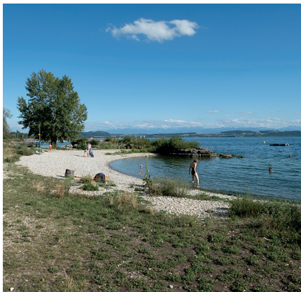
Die Wanderung bietet mehrere Bademöglichkeiten, zum Beispiel bei Saint-Blaise.