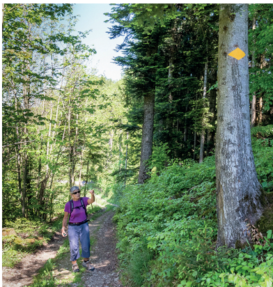
Ruth Scherrer kontrolliert regelmässig 40 Kilometer Wanderwege im Thurgau.