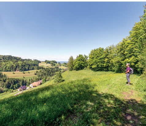
Kurz vor Fischingen: weite Aussicht bis zuletzt.

Restaurant Frohsinn, Dussnang, 071 535 05 69 In Dussnang gibt es weitere Gasthäuser.