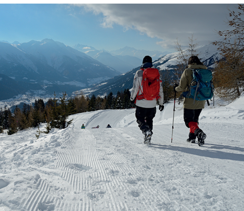
Zu Beginn der Wanderung blickt man ins Goms.