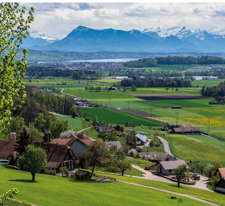
Blick über Maue- und Sempachersee zur Rigi.

Erreichbar ist Sursee mit dem Zug von Bern, Luzern oder Olten.