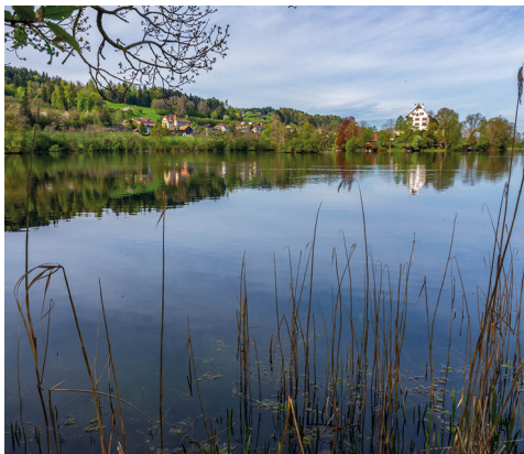
Der Mauesee. Das Schloss ist in Privatbesitz.