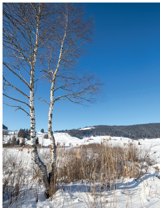
Die Wanderung führt über das grösste Hochmoor der Schweiz.