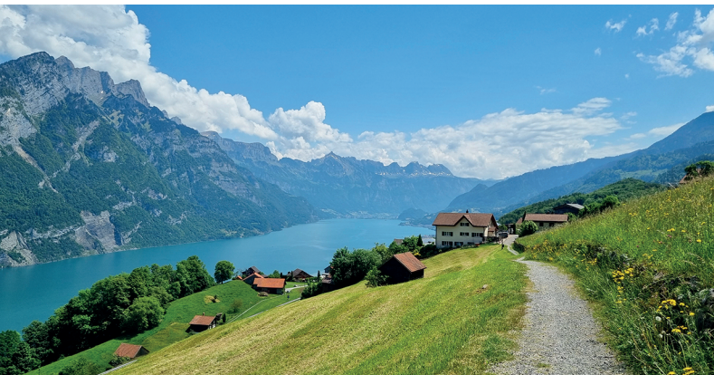
Hoch über dem Walensee entfaltet sich ein eindrückliches Panorama.

Gasthof Hirschen, Obstalden, hirschen-obstalden.ch