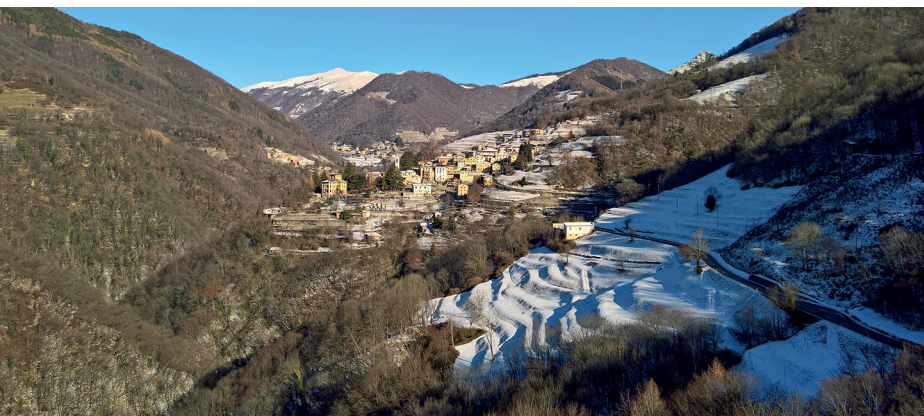
Ein Hauch von Schnee überzieht die Umgebung von Bruzella.

Grotto del Tiro, Caneggio, 091 684 12 40 Ristorante Lattecaldo, Morbio Superiore, 091 684 12 40, www.ristorantelattecaldo.ch