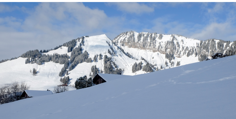
Von der Dürrenbodenalp blickt man auf die steilen Südhänge des Stanserhorns und des Chli Horns links.

Luftseilbahn Wirzweli: www.wirzweli.ch Luftseilbahn Gummenalp: www.gummenalp.ch Alpenrestaurant Wirzweli, 041 628 14 14, www.wirzweli.ch Gasthaus Restaurant Waldegg, 041 628 15 60, www.waldegg-wirzweli.ch Berggasthaus Gummenalp, 041 628 14 25, www.gummenalp.ch Alpwirtschaft Langboden-Stubli, 041 628 13 44 Huismatt (Gaden und Hofladen), 041 628 14 85, www.huismatt.ch