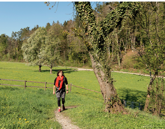
Lieblicher Wanderabschnitt bei Friedberg.

Restaurant Friedberg, Amlikon, 071 651 12 14, www.restaurant-friedberg.ch V7 Bar, oberhalb von Thundorf, 052 376 47 47, www.v7bar.ch