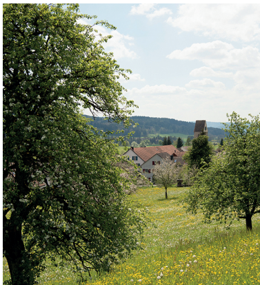
Durch die Baumkronen hindurch grüsst Lustdorf.