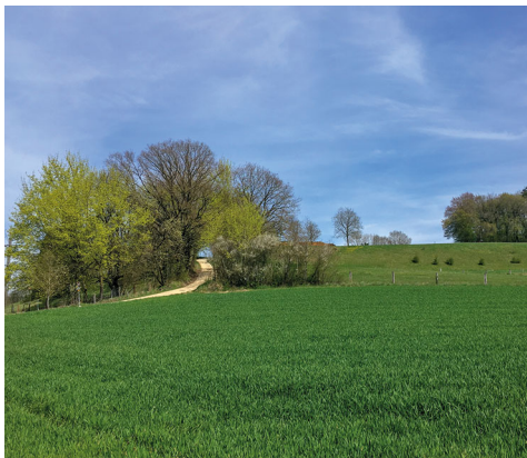
Liebliche Landschaft bei Ramsen.