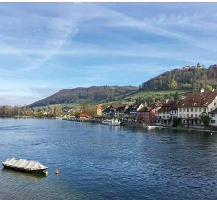
Der Rhein in Stein am Rhein lockt nach der Wanderung zum Sprung ins erfrischende Nass.

Erreichbar ist Ramsen, Petersburg mit dem Bus von Schaffhausen.