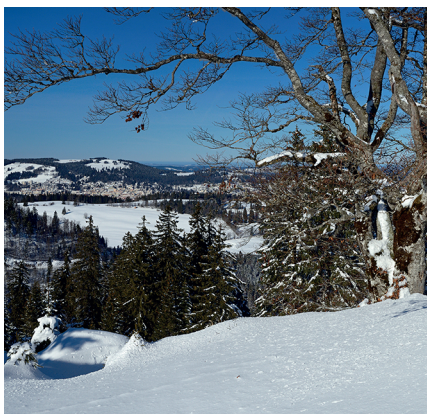
Gegen Norden ist La Chaux-de-Fonds sichtbar.