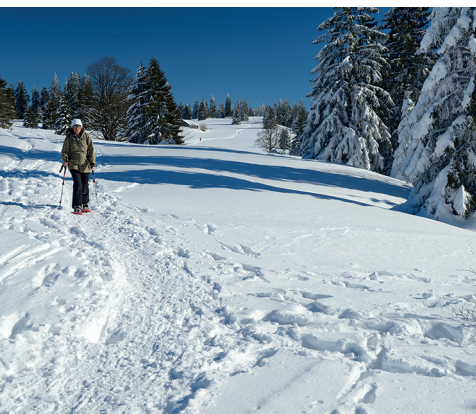
Lichter Wald säumt den Weg auf der Krete.

Hôtel de la Vue-des-Alpes, 032 854 20 20, www.vue-des-alpes.ch