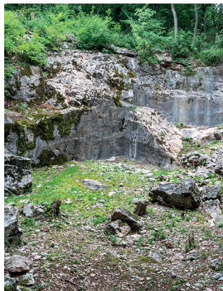
Die Cave di Marmo d'Arzo liegen heute verlassen da.