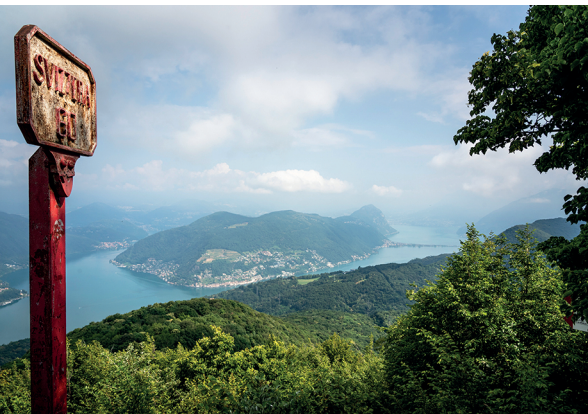
Aussicht vom Poncione d'Arzo über den Lago di Lugano.

Osteria da Sergio, Arzo, 091 646 42 26 Al Tronchio Antico, Arzo, 091 646 49 94 Bottega Bar l'incontro, Meride, 091 646 29 47 La Crisalide, Meride, 091 646 10 54, www.lacrisalide.ch Hotel Serpiano, 091 986 20 00, www.serpiano.ch