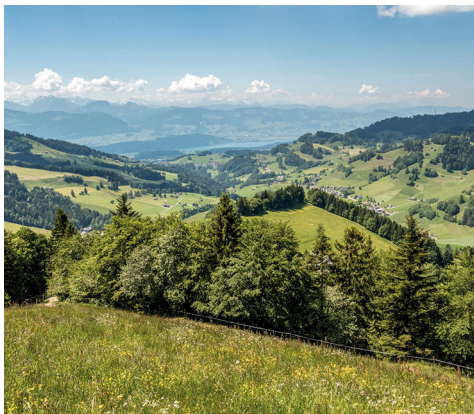
Ein Blick zurück in Richtung Zürichsee.