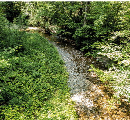
Der Goldingerbach ist bei Atzmännig erst ein Rinnsal.

Berggasthaus Chrüzegg (mit Zimmern), 055 284 54 84, chruezegg.ch