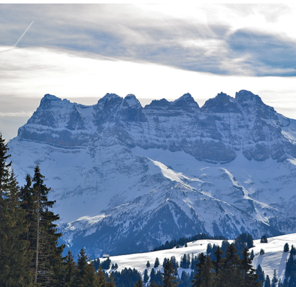
Auf dieser Schneeschuhtour sind die imposanten Dents du Midi allgegenwärtig.

Erreichbar ist «Morgins, poste» mit dem Bus ab Bahnhof Troistorrents. Ein Sessellift bringt einen dann zur Bergstation «Les Têtes». Bitte überprüfen Sie die Betriebe der Bergbahnen (48 Corbeau).