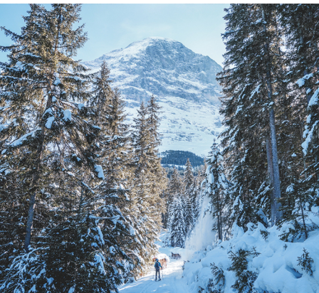
Durch eine Waldschneise zeigt sich der Eiger.

Erreichbar ist Holenstein mit der Gondelbahn Grindelwald–Männlichen ab der neuen Zughaltestelle Grindelwald, Terminal. Rückreise ab Brandegg nach Grindelwald. Bergrestaurant Brandegg, 033 853 10 57,